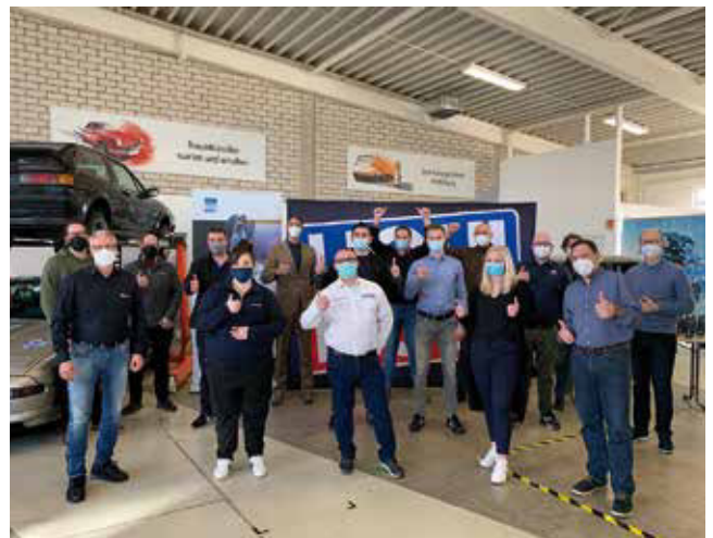
Abb. 2: Die frischgebackenen Kfz-Serviceberater, die Trainer der TAK und der BBE sowie Mitglieder der Prüfungskommission.

Vom 18.-28.01.2022 fand der BRV-Lehrgang „Kfz-Serviceberater im Reifenfachhandel“ in Köln-Wahn und Rösrath statt. Unternehmen wie Reifen Blumenstock, Emigholz, Auto Freydanck, Reifen Fricke, Hammes Reifen und Autoservice, Pneuhage Reifendienste Ost, Pneuhage Reifendienste Süd und Reifen Thomsen Tarp schickten ihre Mitarbeiterinnen und Mitarbeiter zur neuntägigen Schulung. An den ersten drei Schultagen bekamen die Teilnehmer im Labor der Technischen Akademie des Deutschen Kraftfahrzeuggewerbes (TAK) in Köln-Wahn unter anderem eine Einführung in die Kfz-Technik, befassten sich mit Werkstattinformationssystemen und erlernten das effiziente Durchführen einer Dialogannahme. Ab dem vierten Tag ging es dann in Rösrath weiter mit Themen wie dem betrieblichen Umfeld des Kfz-Serviceberaters und der erfolgreichen Serviceberatung. Zu guter Letzt standen noch die Punkte „Innovative Produkte und Konzepte für den erfolgreichen Kfz-Service“ und „Kennzahlen im Servicegeschäft“ auf der Agenda, bevor die Teilnehmer am abschließenden Prüfungstag schriftlich und mündlich das erworbene Wissen und Können unter Beweis stellen mussten (Abb. 2).